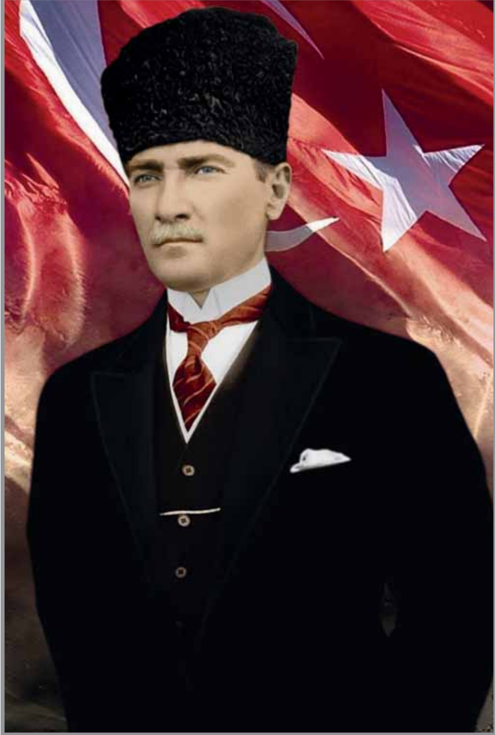
Mustafa Kemal ATATÜRK Türkiye Cumhuriyeti Kurucusu