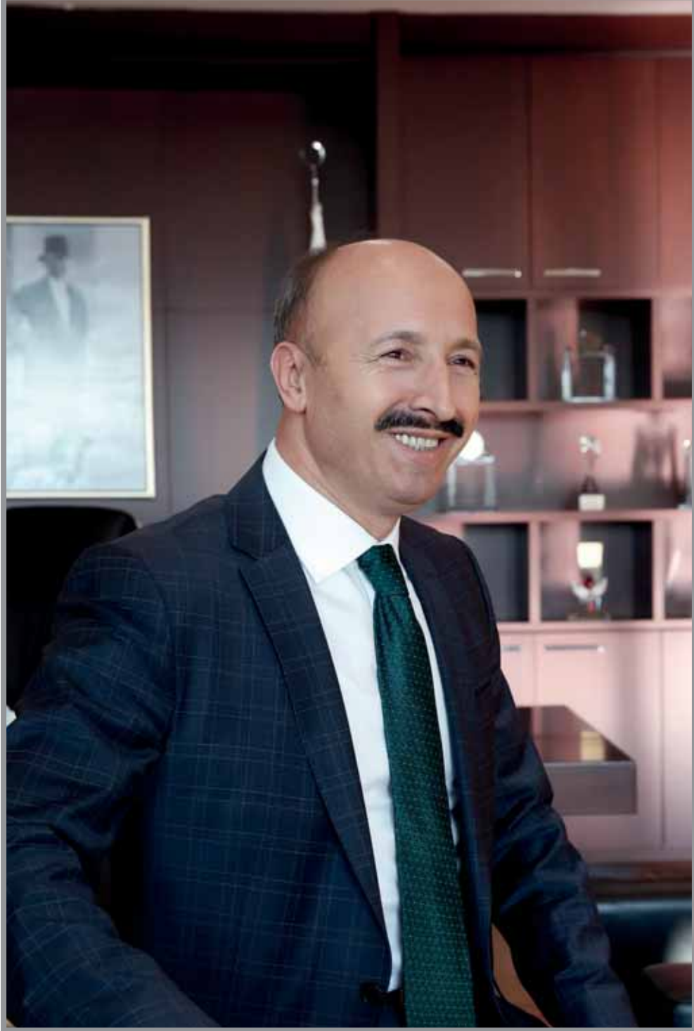
Cahit ALTUNAY Sultangazi Belediye Başkanı