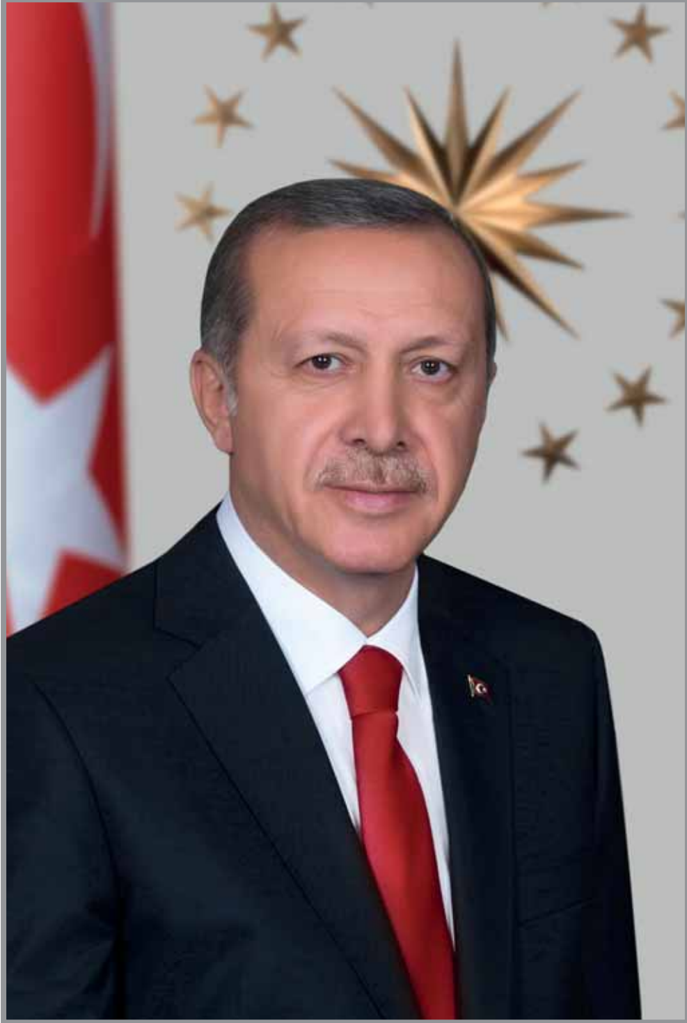
Recep Tayyip ERDOĞAN Türkiye Cumhuriyeti Cumhurbaşkanı