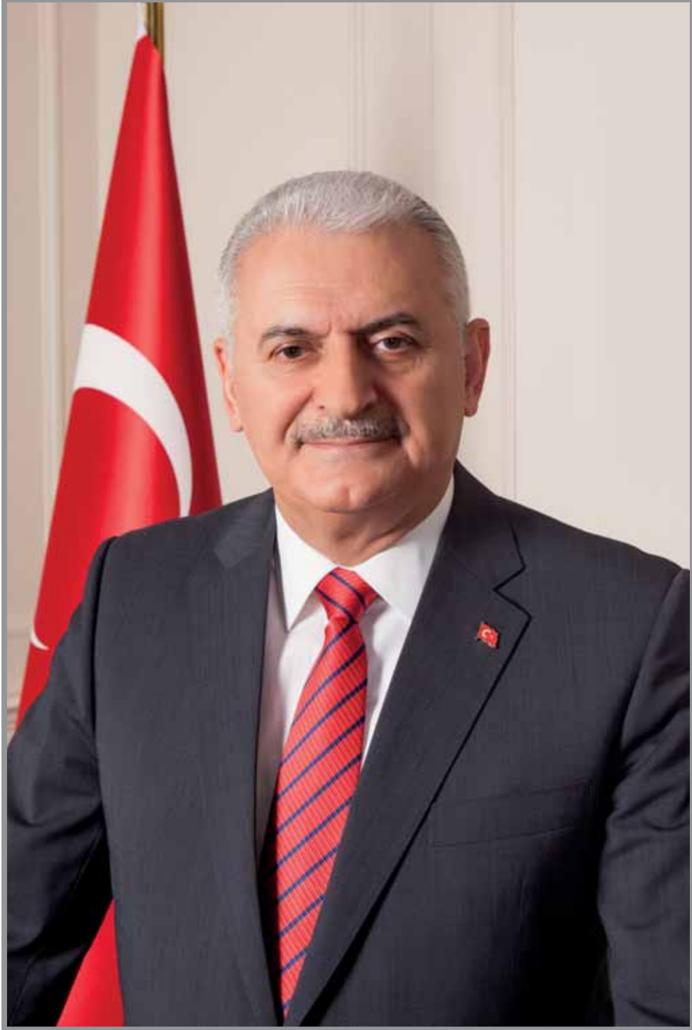
Binali YILDIRIM Türkiye Cumhuriyeti Başbakanı