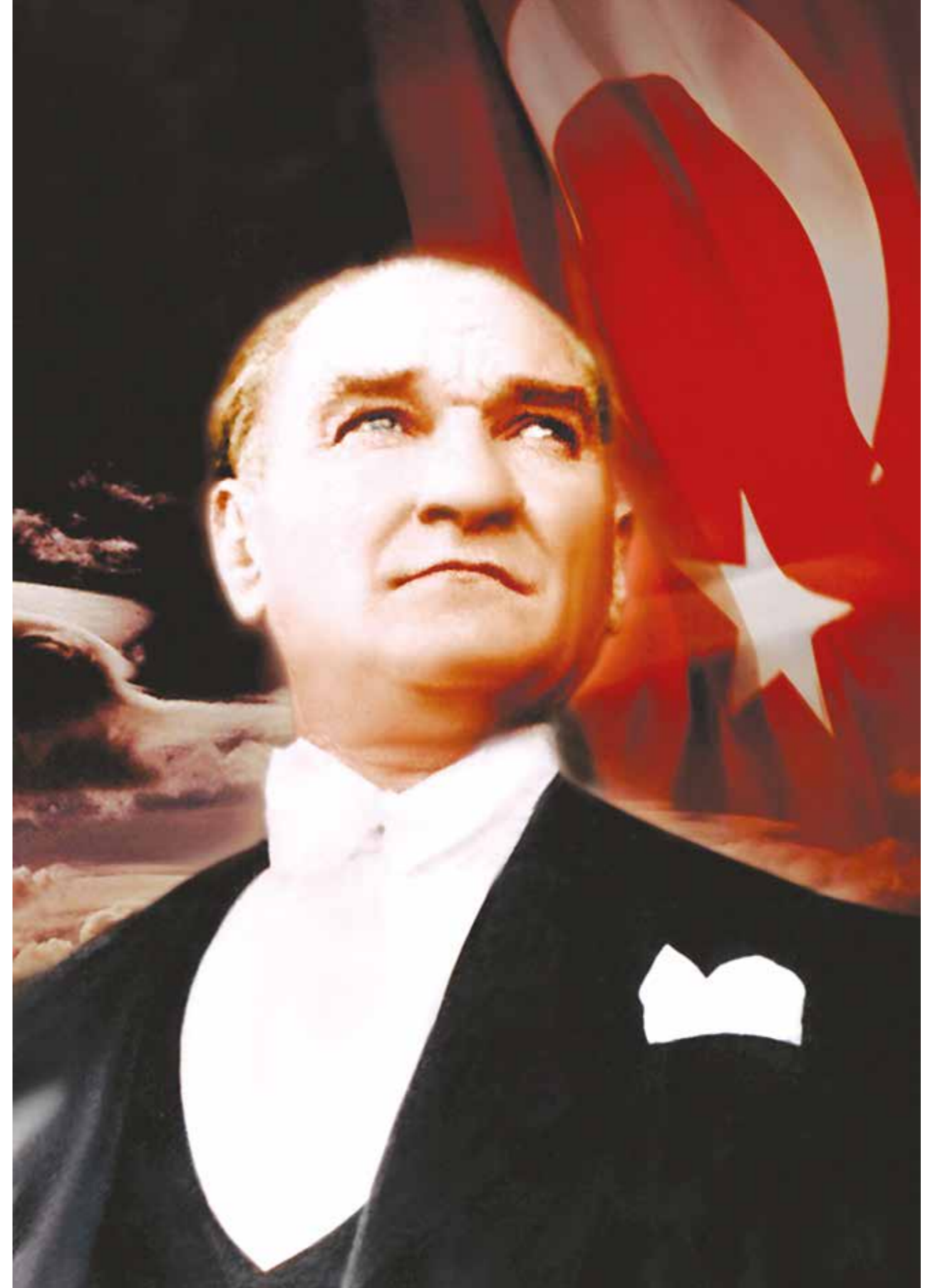
Mustafa Kemal ATATÜRK Türkiye Cumhuriyeti Kurucusu