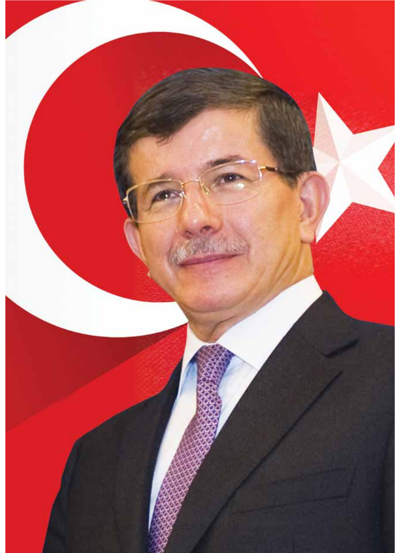
Ahmet DAVUTOĞLU Türkiye Cumhuriyeti Başbakanı