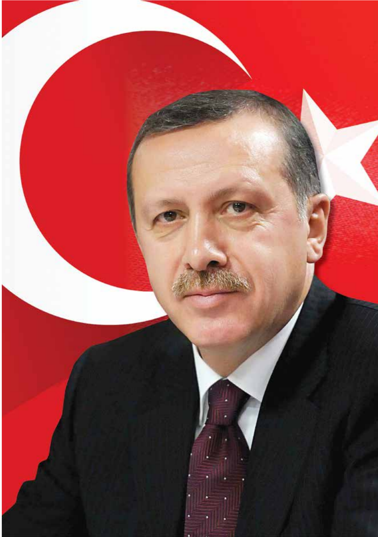
Recep Tayyip ERDOĞAN Türkiye Cumhuriyeti Cumhurbaşkanı